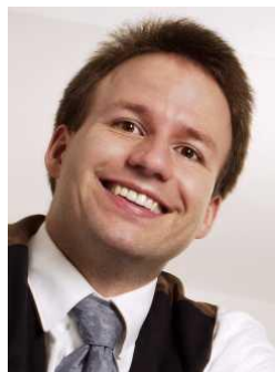
Ihr Autor: Thomas Adolph

Vilbeler Landstr. 186 60388 Frankfurt Tel.: 06109-50560 Fax: 06109-505629