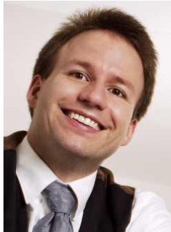
Ihr Autor: Thomas Adolph

Vilbeler Landstr. 186 60388 Frankfurt Tel.: 06109-50560 Fax: 06109-505629