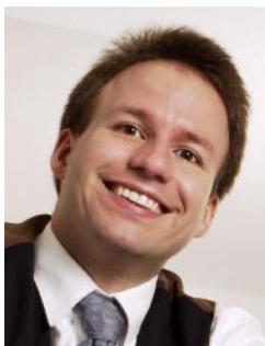
Ihr Autor: Thomas Adolph

Vilbeler Landstr. 186 60388 Frankfurt Tel.: 06109-50560 Fax: 06109-505629