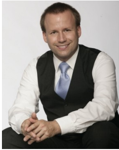
Ihr Autor: Thomas Adolph

Vilbeler Landstr. 186 60388 Frankfurt Tel.: 06109-50560 Fax: 06109-505629