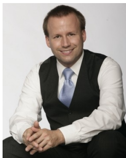
Ihr Autor: Thomas Adolph

Vilbeler Landstr. 186 60388 Frankfurt Tel.: 06109-50560 Fax: 06109-505629